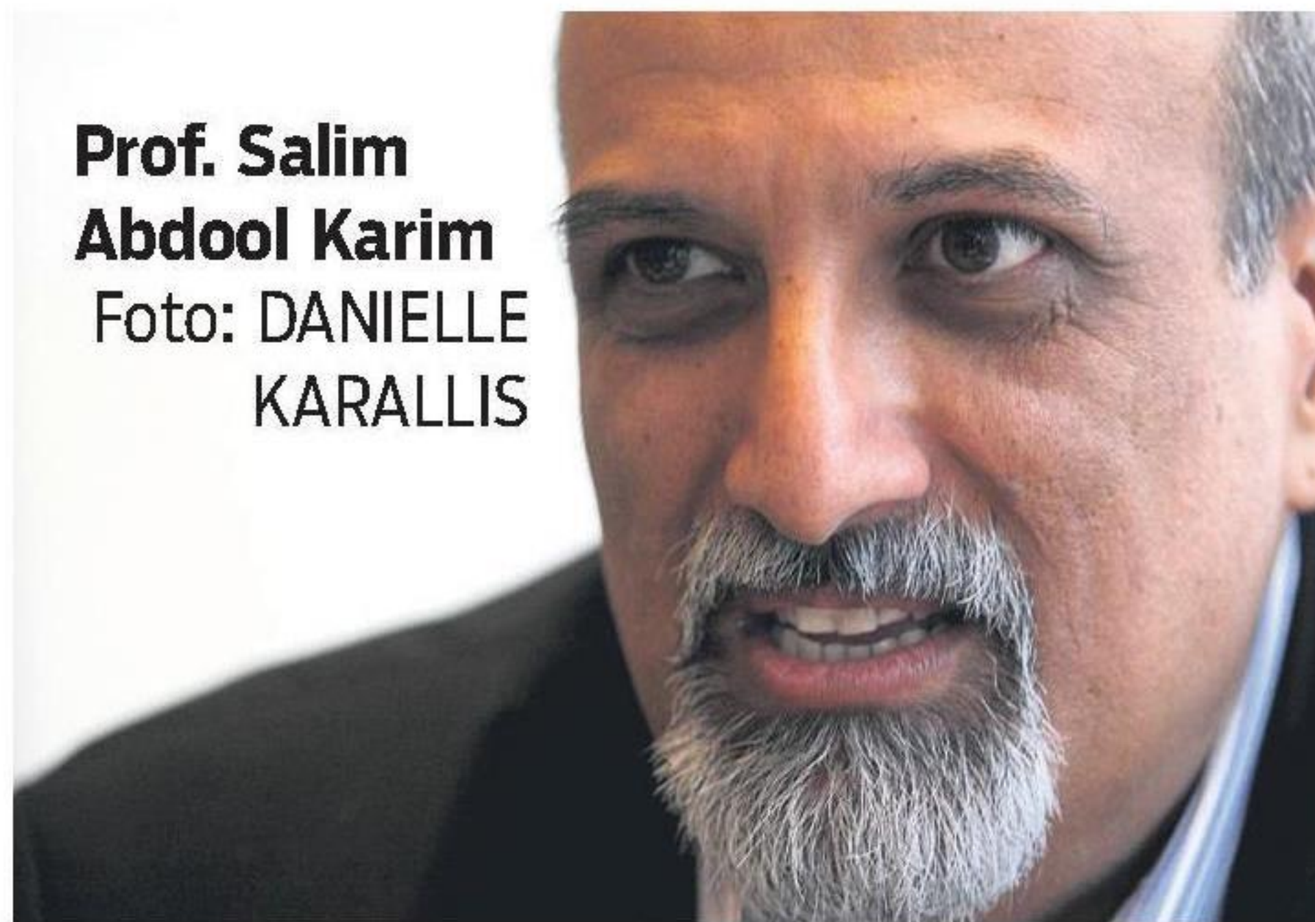
Prof. Salim Abdool Karim

Fase drie het aangebreek by Ramaphosa se instelling van die nasionale staat van inperking om kontak tussen mense waar moontlik te verminder ten